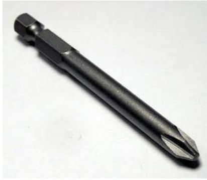
Накрайник за отвертка с кръстообразна глава PH